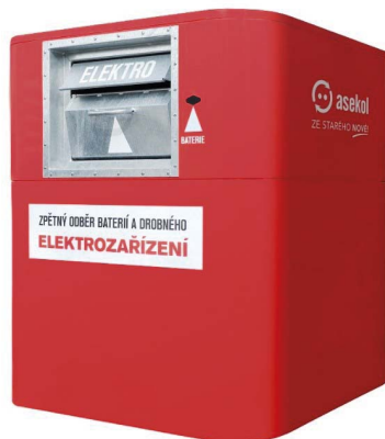
Klasický červený kontejner