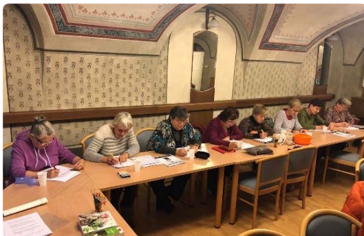
Ilustrační foto z českokrumlovského centra pro seniory

Tato aktivita je součástí širšího projektu „Podpora rodin a seniorů na území MAS Blanský les – Netolicko“, který je podpořen z prostředků Evropského sociálního fondu.