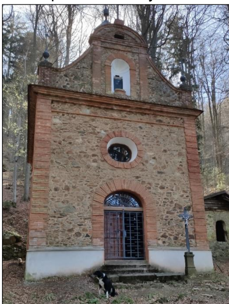
Kaple Sv. Filipa Neri