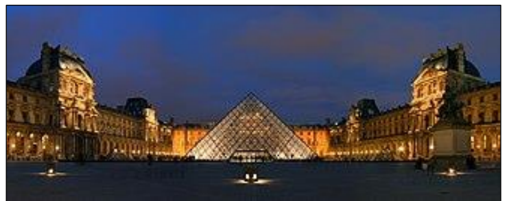
Paříž - Louvre