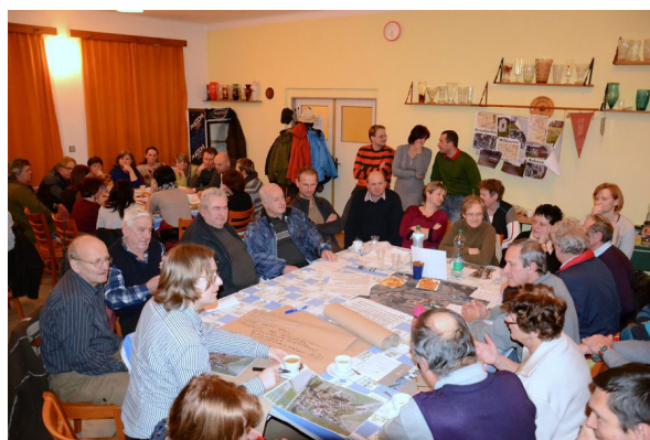
Veřejné projednání - Krasejovka